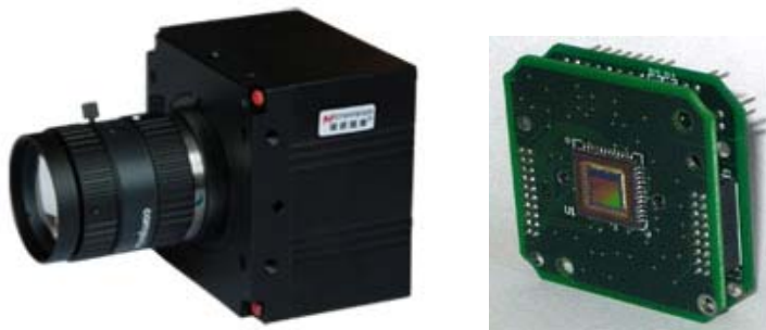
相机模组尺寸：49×49mm，批量客户可按要求定做。

AFT-USB2.0彩色/黑白工业数字摄像机可通过外部信号触发采集或连续采集，可应用于文字识别、显微图像、医学图像采集、证件制作、文档电子化，工业测量、工业检测、PCB检测、半导体及元器件检测等机器人视觉等领域。